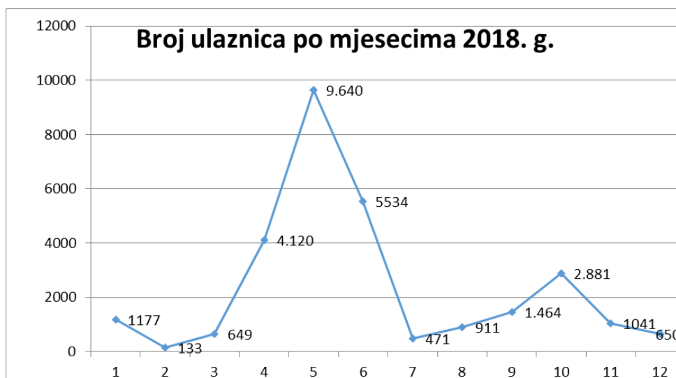
Grafikon 3: broj ulaznica po mjesecima (2018. godina)

Iz grafikona su vidljivi podaci o popunjenosti Ivanine kuće bajke. Pored navedenog, izvršena je analiza organiziranih grupa po županijama, a temeljem istih su osmišljene taktike za poboljšanje popunjenosti tijekom dijela godine kada manji broj organiziranih grupa posjećuje